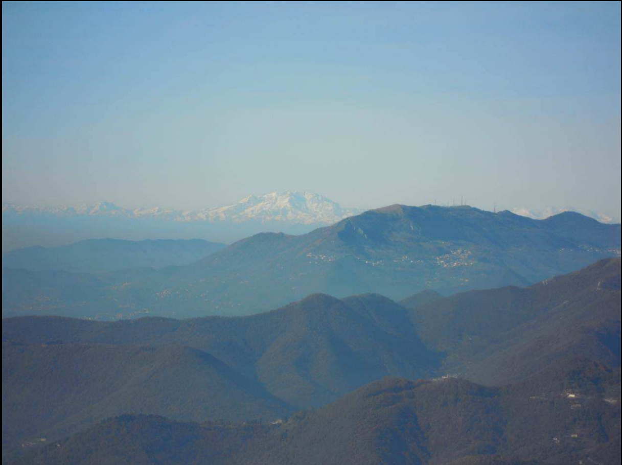
Gran Paradiso a sx 4061mt, Monte Rosa 4634mt; Roncola