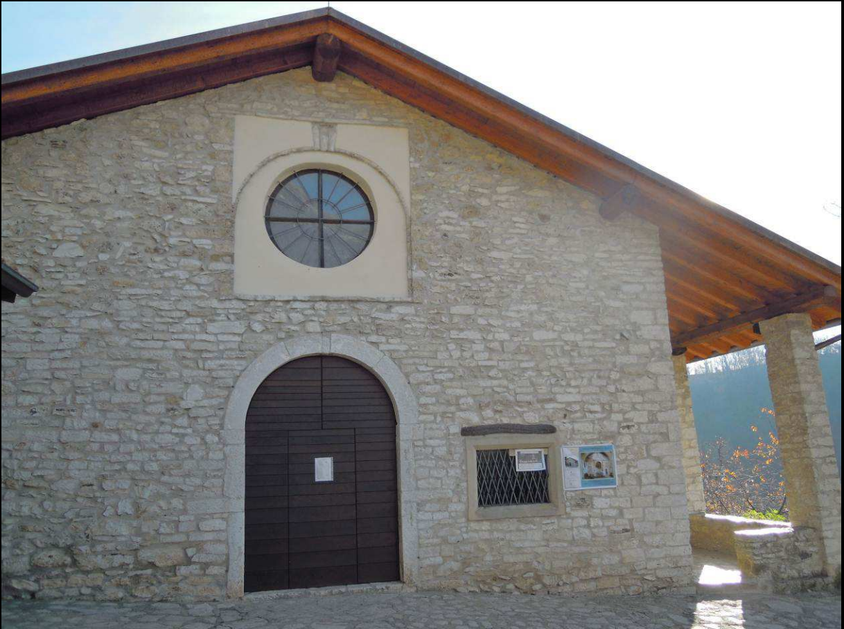
Chiesetta Madonna del Misma