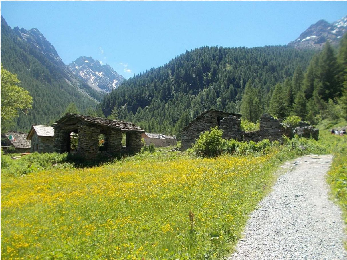
Baite dell'alpe Forbesina