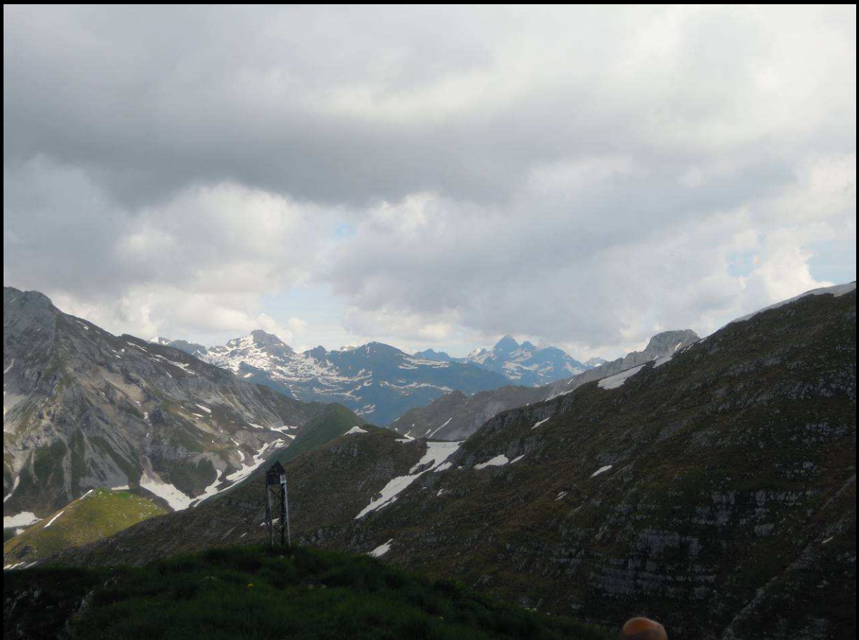
Diavolo e Diavolino