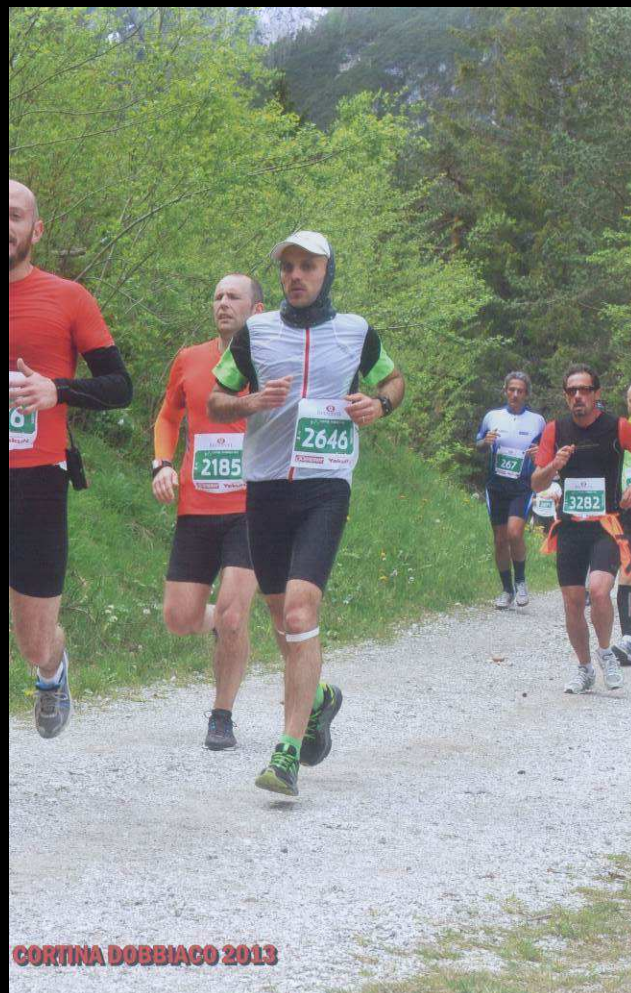
CORTINA DOBBIACO 2013