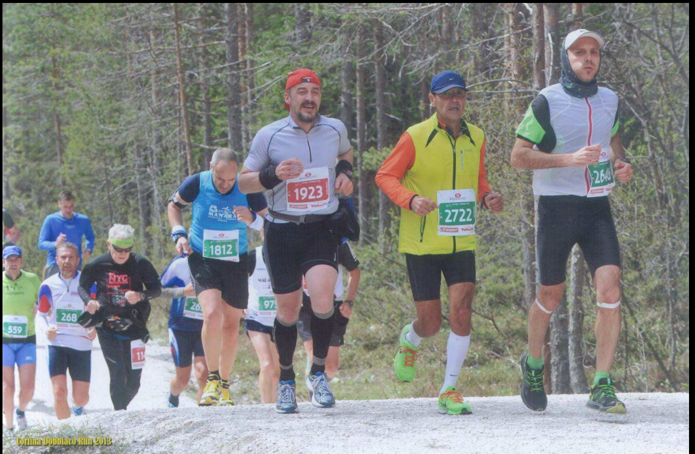
Cortina Dobbiaco Run 2013