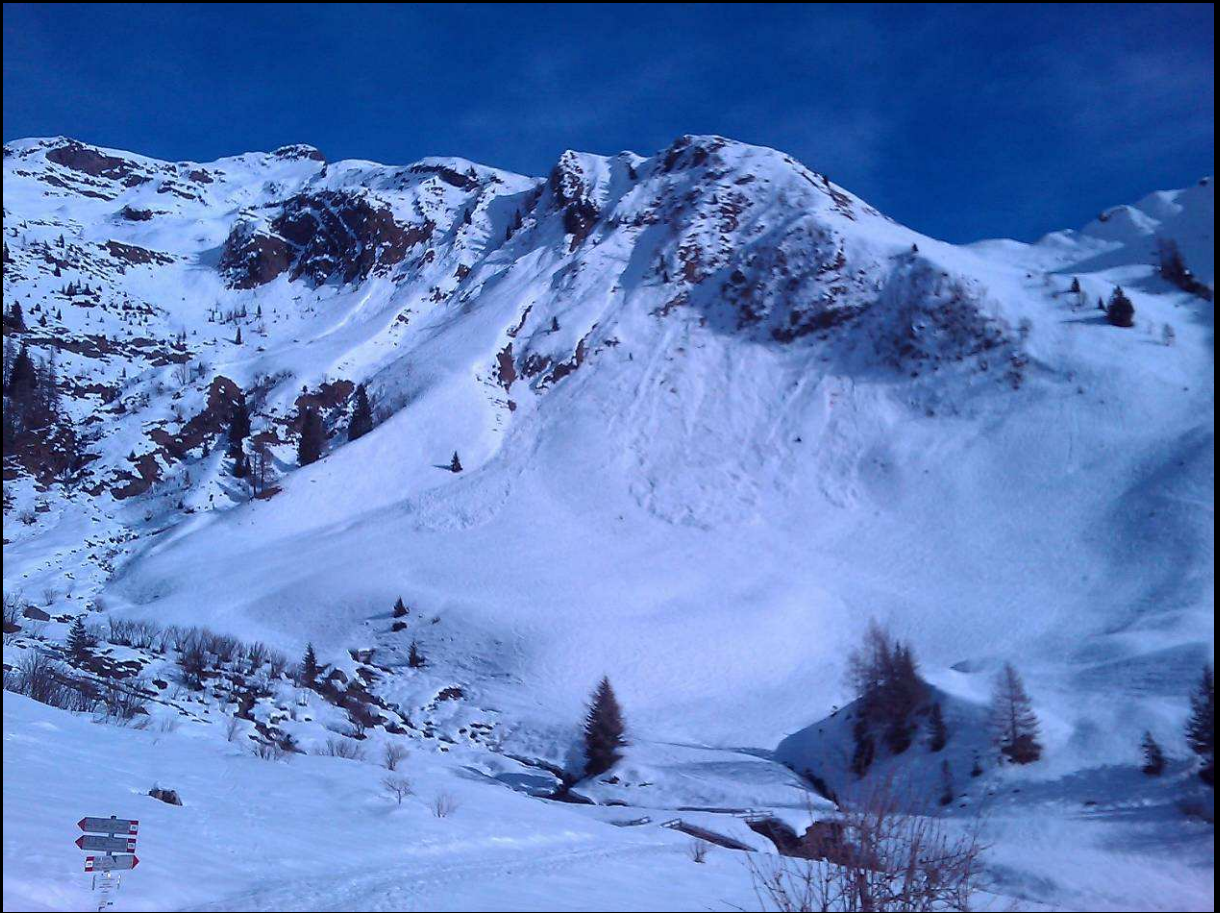
Conca di Mezzeno