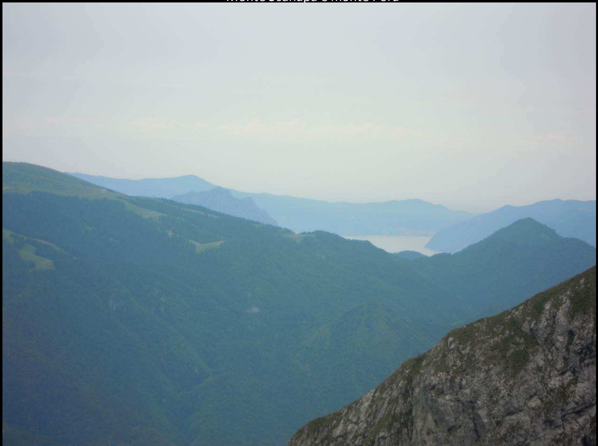
Lago D'Iseo con Montisola