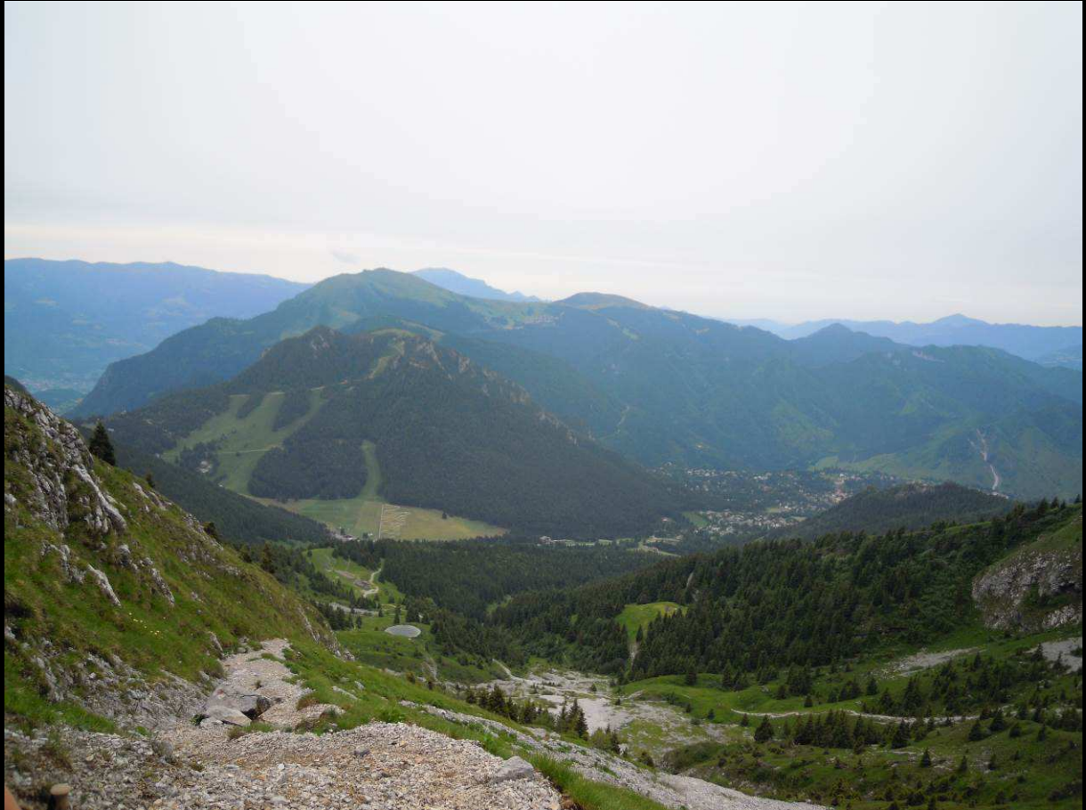
Monte Scanapà e monte Pora