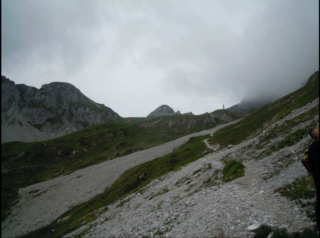
Bivacco città di Clusone