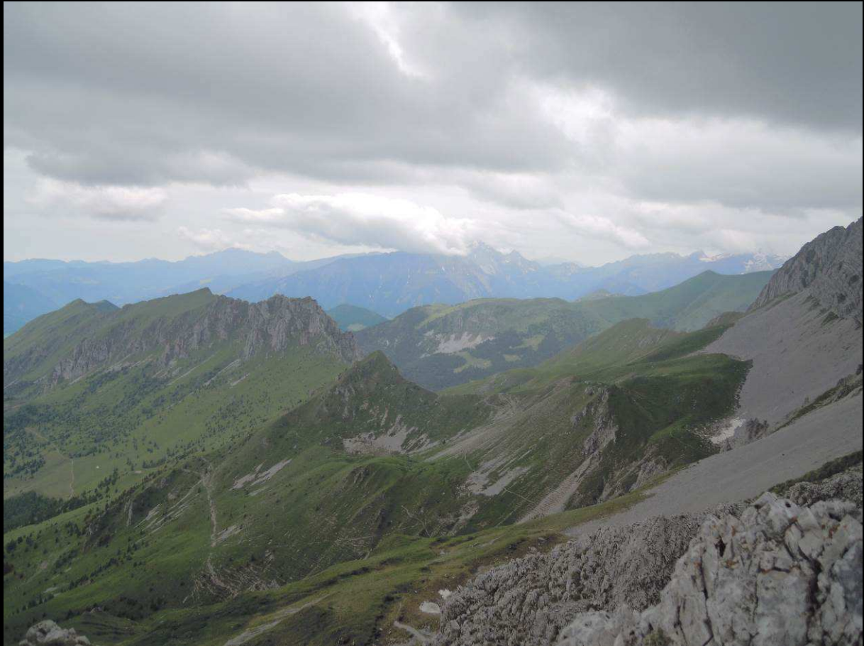
Veduta dal passo di Pozzera