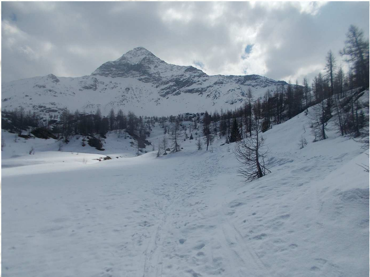
Pizzo Scalino 3323mt