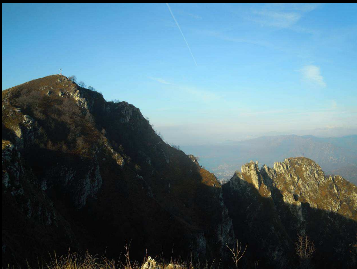
II e III Croce