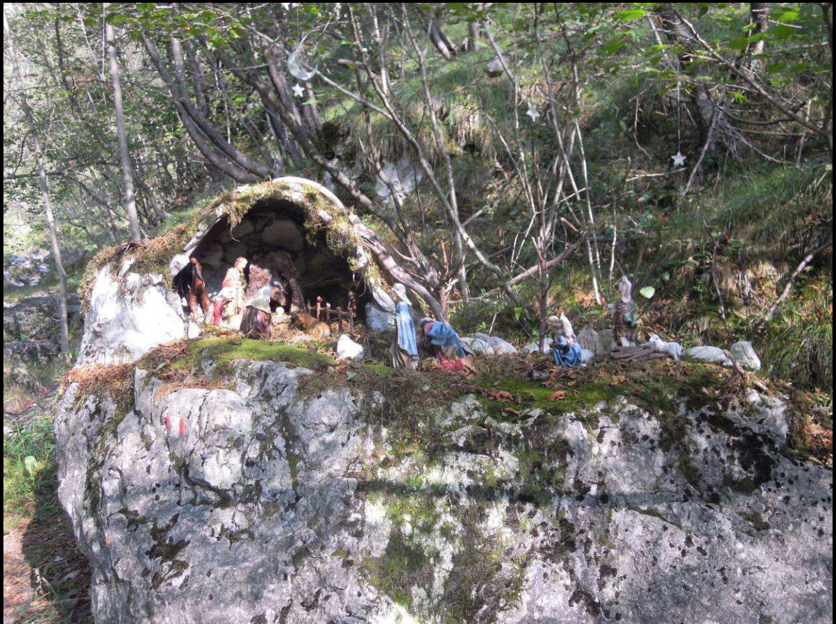
Presepe incontrato sul percorso