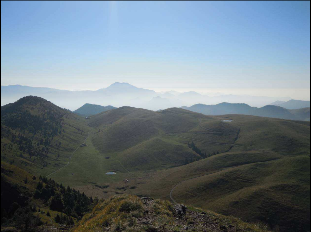
Vista verso Rifugio Parafulmine