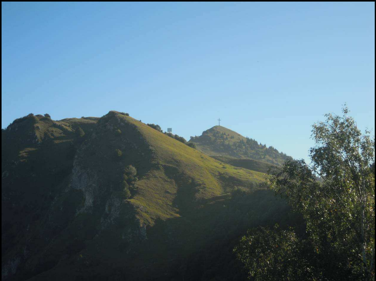
Croce Pizzo Formico